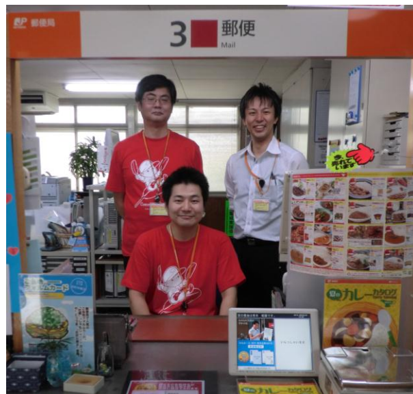
赤い羽根Tシャツを着用した職員